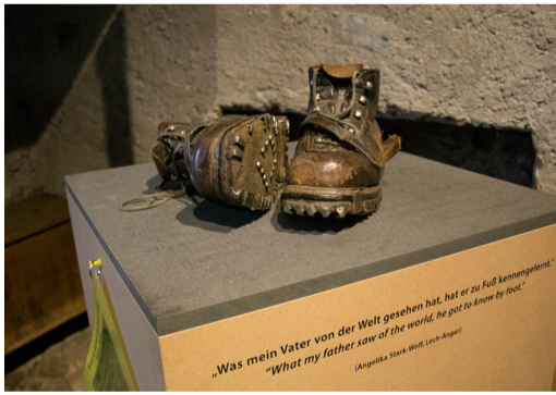
Fotos Ausstellung GEHEN am BERG