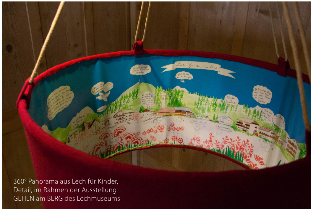
360° Panorama aus Lech für Kinder, Detail, im Rahmen der Ausstellung GEHEN am BERG des Lechmuseums